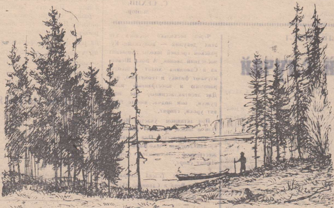
НА ОЗЕРЕ ТАРАИ.

Это не фантастика: противотуманные установки ЖКУ-2.ЦАО демонстрируются в павильоне «Гидрометслужба» ВДНХ СССР. Несколько таких аппаратов устанавливаются на аэродромах и, воздействуя на туман активным реагентом — углекислотой, «растворяют» его.